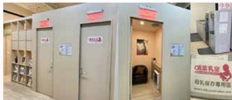
112 年重設置哺（集）乳室（圖示）

這份正向的回饋正是公司持續投入友善設施的驅動力。每一次看見同仁安心、愉快的使用經驗，皆再次印證「以人為本」的核心價值，並鞏固本公司在永續發展與社會責任上的堅實步伐。除此之外，藉由專業醫護人員協助員工年度健康規劃及確認員工工作環境安全，包括燈光、座椅、電腦螢幕及哺（集）乳室等，不僅提供舒適且安全的工作環境，亦幫助員工平衡工作和家庭職責，減少同仁壓力和焦慮。